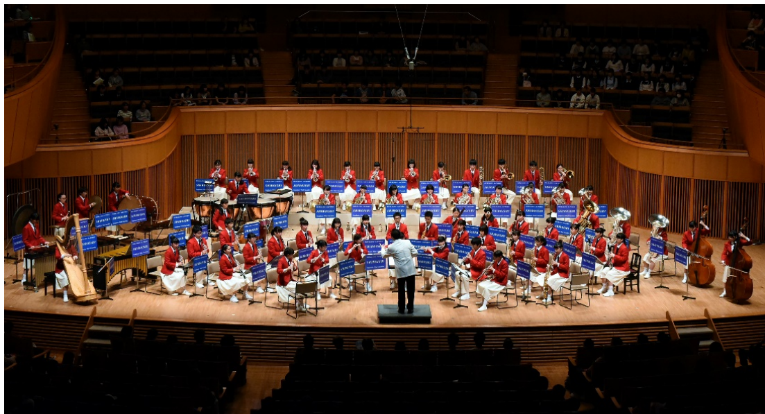
北海道札幌白石高等学校吹奏楽部 第35回定期演奏会 於 札幌コンサートホールKitara 2018.6.10